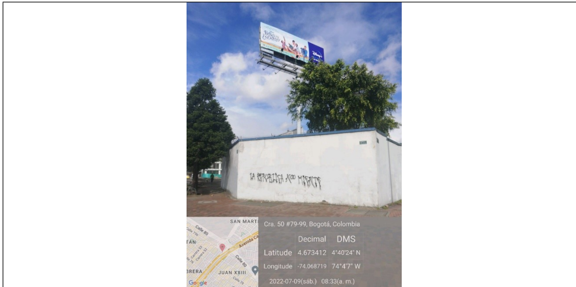
Foto 1. Vista panorámica del predio y de la valla ubicada en la Calle 79 B No. 30 - 23 (dirección catastral) orientación Norte-Sur